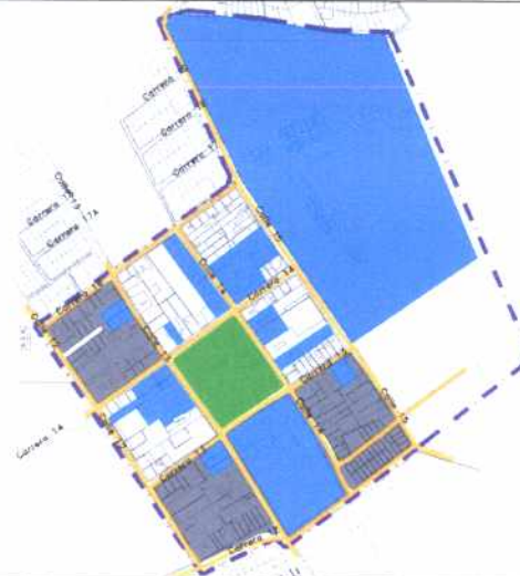
Inmuebles de Interés Cultural - MORFOLOGÍA EN PLANTA

Conservación Sector de Interés Cultural FORMA REGULAR FORMA IRREGULAR PARQUE LÍMITE DEL BARRIO VIAS PRINCIPALES VIAS SECUNDARIAS VIAS LOCALES