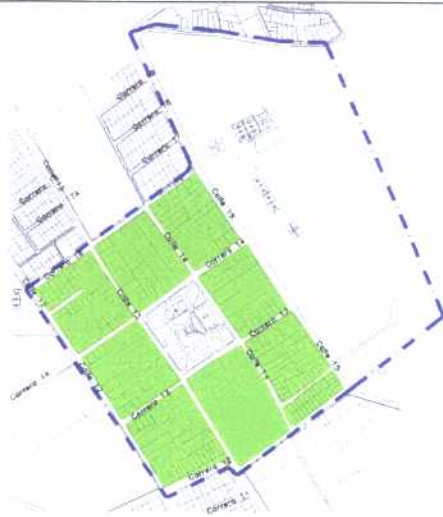
CRECIMIENTO HISTÓRICO - CRONOLOGÍA